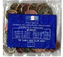
Des sachets collectors !