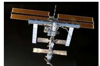
La station spatiale internationale en construction ...