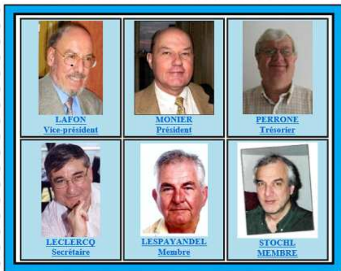
Association Astrophilatélique de France

Depuis 5 ans le mouvement d'ouverture vers les acteurs de l'astrophilatélie : FFAP, clubs, créateurs, fabricants et fournisseurs de timbres est le résultat d'un travail collectif du conseil d'administration et de quelques adhérents.