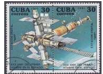
Timbre de la station MIR