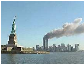
Les tours du World Trade Center en feu