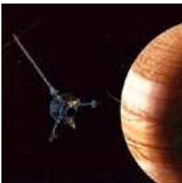
Galiléo frôle Jupiter